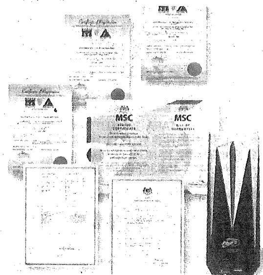
EONMETALL 集团子公司获得 MSC 资格及荣获 ISO9001:2000 品质确认证书，其产品更获得专利权注册以及多项设计专利，同时在 2000 年获得推荐，成为首 50 间杰出企业公司。

济的成长贡献良多。EONMETALL 集团亦策划未来，预计于 2005 年年终，将钢工机械及配备制造增加，其中包括镀锌及彩涂板加工设备 (galvanising machine, prepainted galvanising machine)、带钢冷轧机械 (enchanced cold-rolled mill) 及货仓自动化系统。于 2006 年，该集团计划朝更多元化的钢工机械及配备研发制造发展。